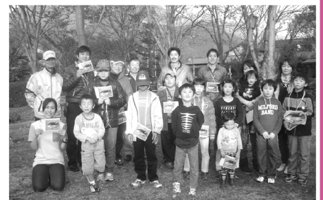
大分川河川環境学習会