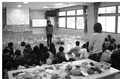
由布院小学校の総合学習授業の様子