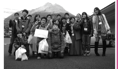
第10回ふれあい交流子ども使節団 水原市青少年育成財団との交流