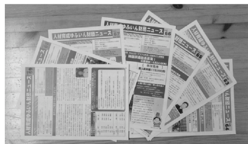
財団ニュースの発行による情報発信