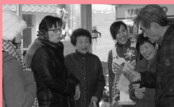
■商店街の人に出会いながらおつかいを済ませます