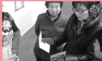
■おつかい(指令や謎解き)のメモが渡されます