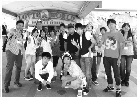
ロッテワールドで記念撮影