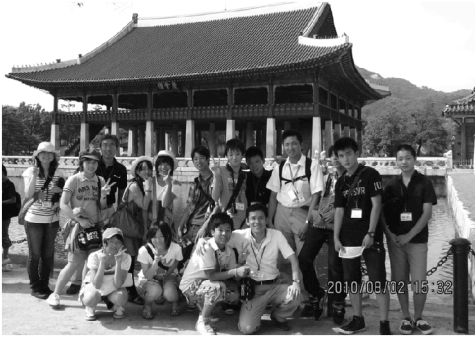
世界遺産の景福宮を訪問