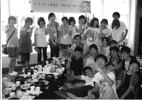
清明中学校の生徒と一緒に昼食交流会