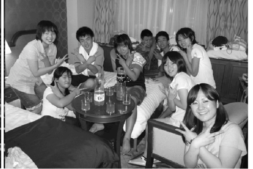
宿泊ホテルでの打ち上げ会