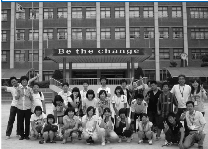
第9回使節団 韓国・水原市清明中学校での交流会記念写真

公益財団法人 人材育成ゆふいん財団 〒879-5102 由布市湯布院町川上2863 (クアージュゆふいん健康温泉館内) TEL: 85-4748 FAX: 85-4759 (応募はFAXも可)