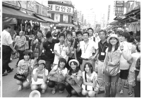
南大門で班に分かれて買い物体験