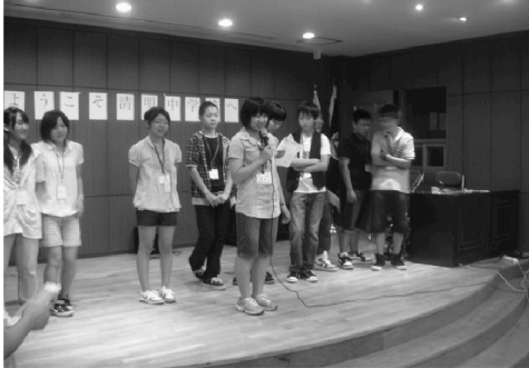
清明中学校を訪れ自己紹介・まち紹介