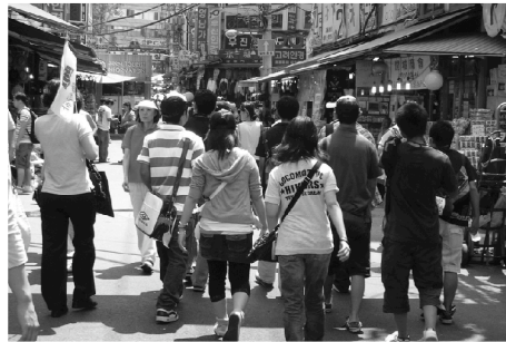
第7回使節団 [韓国] 南大門で買い物に挑戦