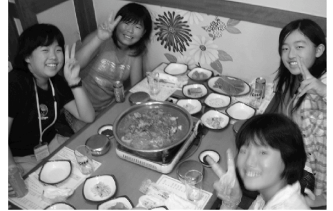
第7回使節団 [韓国] 夕食で韓国の代表的料理のプルコギを食べる