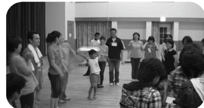
◆準備や後かたづけを大人から子どもまでみんなが行います。