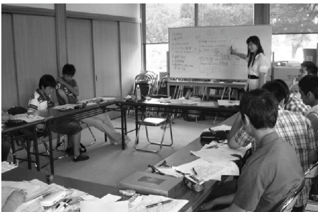
第7回使節団 [韓国] 事前勉強会・講師：APU留学生