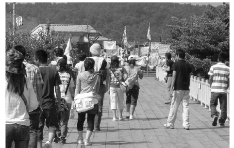
第7回使節団 [韓国] 南北国境・自由の橋を訪問