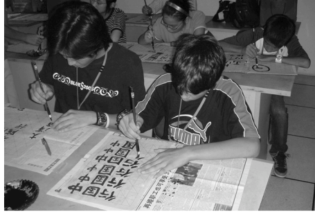
第6回使節団 [上海] 春光社区学校での書道教室