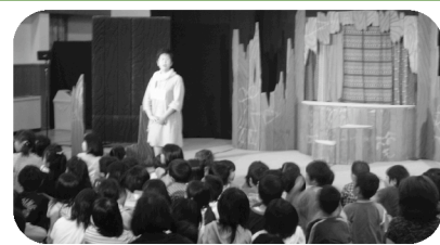
◆実行委員会（にじいろのたね）からのごあいさつ