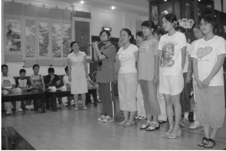
第6回使節団 [上海] 春光社区学校との交流会