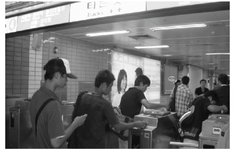
第7回使節団 [韓国] 中心街での地下鉄の乗車