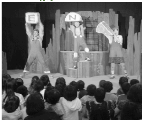
◆今回が8年ぶりの上演となった「番ねずみのヤカちゃん」

6月13日（土）に第12回ゆふいんこども舞台芸術フェスティバル「劇団道化 番ねずみのヤカちゃん」の公演がゆふいん子育て支援センターホール（すみれ保育園内）で開催されました。