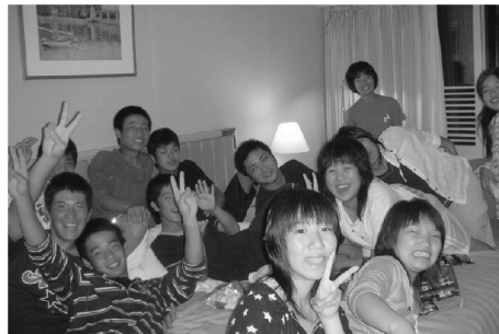
第7回使節団 [韓国] 最終日：小中学生打ち上げ会