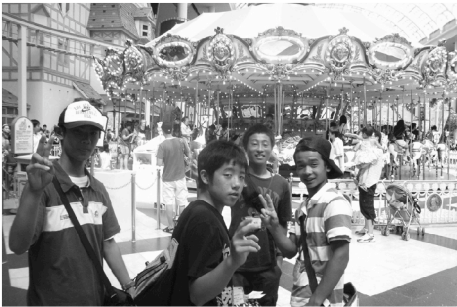
第7回使節団 [韓国] ロッテワールドで英語表記を読み解きながら班別自由行動