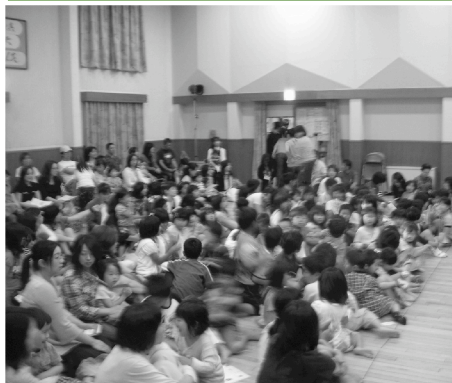
◆公演時間を楽しみに待つ子どもたちの様子