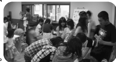
◆たくさんの親子連れが公演に訪れました。