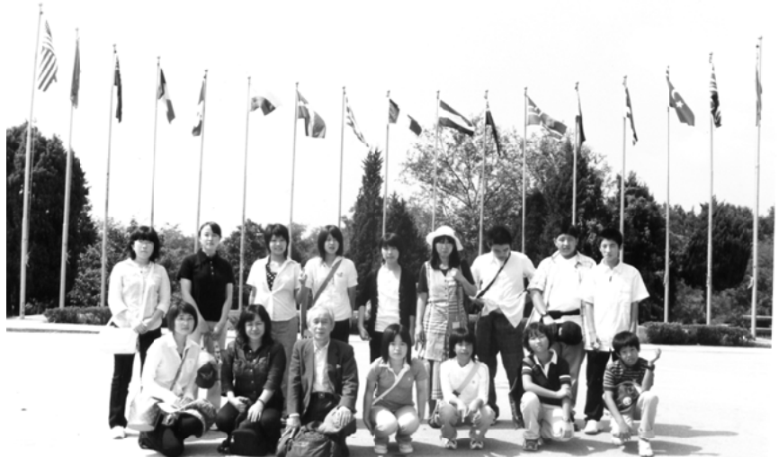
第3回国際交流事業 韓国にて