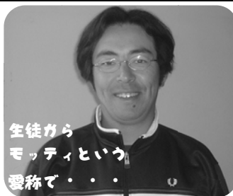
生徒から モッティという 愛称で...

は、県総体を制すること!そして、湯 布院中学校に優勝旗を持って帰りたい。 応援してくださる、多くの方々 に感謝の気持ちを忘れず、期待に応 えられるように、日々努力していこ う!』